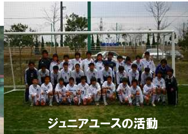
ジュニアユースの活動