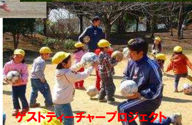
ゲストティーチャープロジェクト