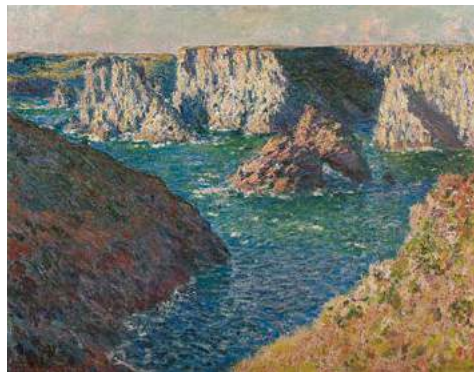
▲茨城県近代美術館〈ランス美術館コレクション〉 クロード・モネ 「ベリールの岩礁」1886年

国内外の優れた美術作品による展覧会や、自然や歴史などに関するテーマを扱った企画展等を開催します。