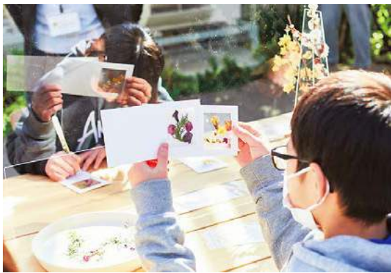
▲ボタニカルカード作り

2月、オープン前の園内で石岡市内の小学生が遠足向けのワークショップを体験しました。