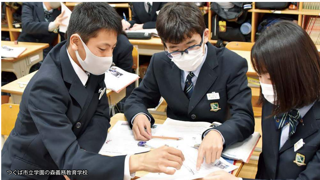
つくば市立学園の森義務教育学校