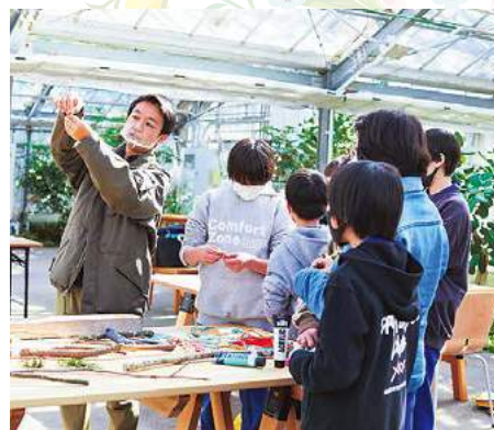
▲作品を作る子供たち

今年4月29日に、自然を体感できる花のテーマパークとしていばらきフラワーパークが、リニューアルオープンしました。「見るから感じる」をコンセプトに、園内で採集した植物を使用したワークショップや自然体験など、五感を使って学べる小中学生向けのアクティビティを多数ご用意!