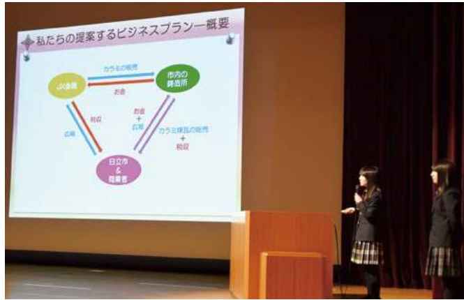
▲プレゼンテーション大会での発表の様子

高校生等を対象に、自分の夢実現や地域の課題解決に向けた企画立案・実践活動を通して、高い創造意欲を持ち、リスクに対しても積極的に挑戦できる力を養成します。