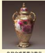
色絵金盛齋文飾 1891-1921年頃 若林コレクション

笠間市笠間2345番地 TEL 0296-70-0011 http://www.tougei.museum.ibk.ed.jp/