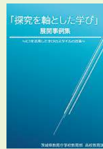
▲探究を軸とした学び(展開事例集)表紙

県教育委員会では、昨年度2月に各教科における探究を軸とした学びの展開事例集を作成して県立高校・中等教育学校・中学校へ配布しました。本事例集は、「教える」から「学ぶ」への学びのスタイル改革に向け、授業において、課題解決に重点をおいた探究的な学びを展開し、生徒の主體的・対話的で深い学びの実現を図ることを推進するために作成し、日々の教科の学びを中心に、ICTを活用した探究的な学びの展開事例を収めたものです。