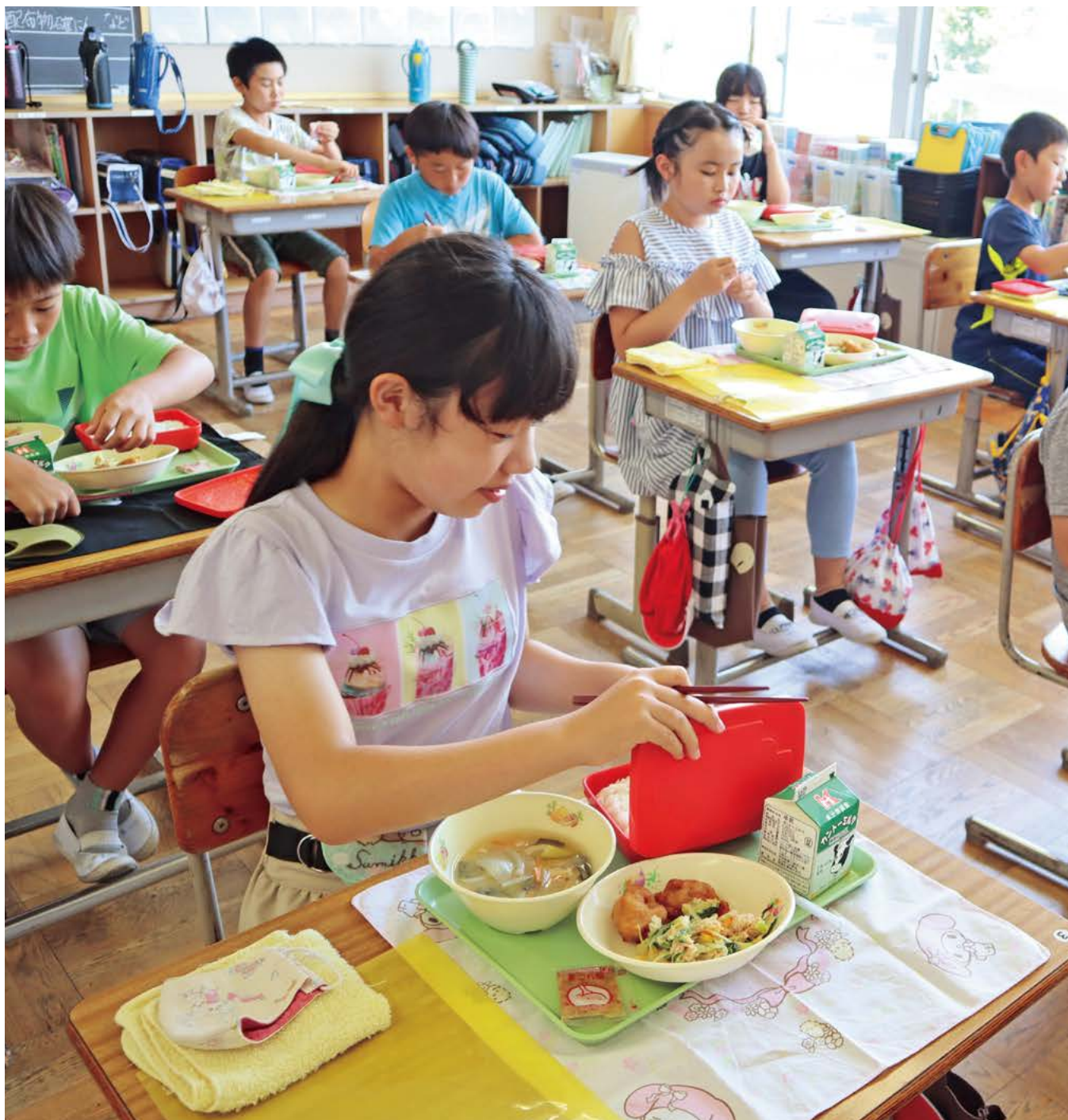
▲コロナ対策として、一人一人が前を向いて食べる給食も日常的な風景となりました（鉾田市立旭西小学校・7月19日撮影）