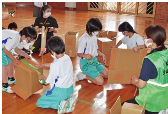
▲段ボールベッドづくりに挑戦

また、防災士の方を講師に招き、ペットボトルを活用した簡易手洗い器の作成や、段ボールベッドづくりを学びました。