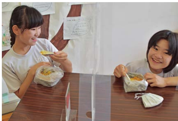
▲災害に備えて防災食を試食