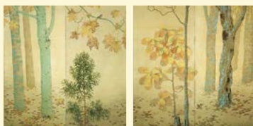
菱田春草「落葉」1909年 茨城県近代美術館蔵

北茨城市大津町椿2083 TEL 0293-46-5311 http://www.tenshin.museum.ibk.ed.jp/