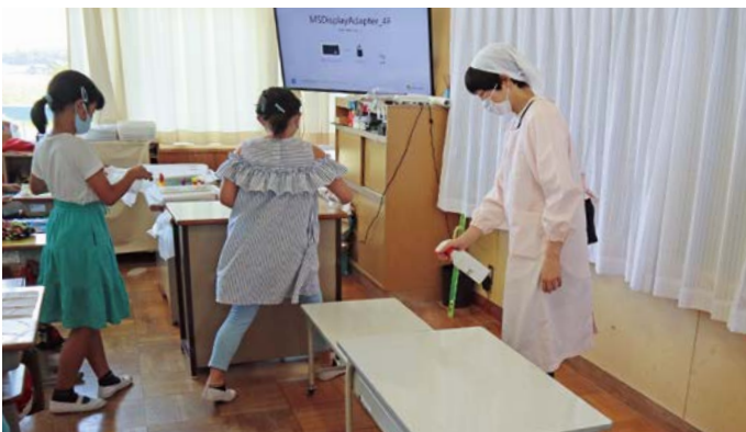
▲配膳前の学校サポーターによる消毒作業（銚田市立旭西小学校）