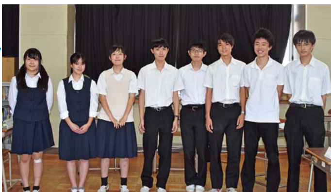
▲実行委員会の部門長のみなさん

こうした例をはじめ、生徒自身が考え、工夫をこらし、困難な状況を乗り越えようと努力しています。