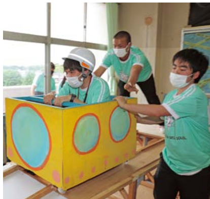
▲生徒にとっては2年ぶりの文化祭

生徒の参加を二日に分け、人数を半数に絞ることで密を回避。観覧の完全事前予約制、屋外休憩所の設置といった対策も、各種ガイドラインを参考に自分たちで考えました。