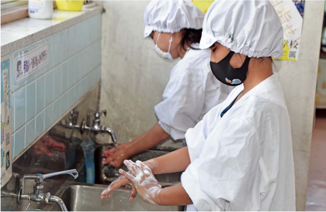
▲給食準備前の手洗いも念入りに（日立市立山部小学校）

新型コロナウイルス感染症の影響が続く中でスタートした令和3年度。学校では3密の回避、マスクの着用、手洗いなどの基本的な対策を徹底しながら、校内の環境づくりや学習・行事等の内容を工夫し、教育活動の継続に向けて取り組んできました。今回は、そうした学校での取組の事例をご紹介します。