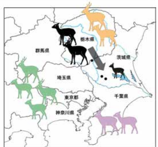
図1. ミトコンドリアDNA解析により明らかとなった茨城県南西部のシカ（黒点は採集地点）の出自。