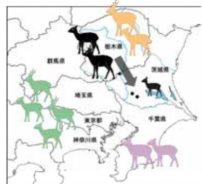
ミトコンドリア DNA 解析により明らかとなった 茨城県南西部のシカ(黒点は採集地点)の出自

茨城県では、過去100年近くニホンジカの生息は確認されていませんでしたが、2013年以降、シカを目撃・捕獲等の情報が報告されるようになりました。そのうち、茨城県南西部に出現したシカの出自の推定は困難でしたが、当館が収集した標本等を遺伝子解析した今回の共同研究により、日光地域に生息するシカの遺伝子型と一致することが解明されました。この結果、シカは河川敷や河川沿いに広がる緑地を利用して日光地域から茨城県南西部に移動した可能性があることが示唆されました。