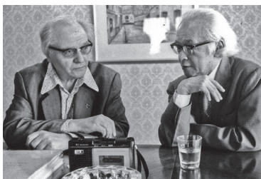
オリヴィエ・メシアン(左)との対談(1978年)

「世界の巨匠」となった頼則だが、歩みを止めることはなかった。まるで求道者のように独自の音楽を追求しつづけた、果てなき挑戦の軌跡を見てゆく。