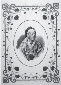
9代石岡藩主・松平頼綱肖像画(明治中～後期、個人蔵)

子爵・府中松平家に生まれた頼則。激変する時代に翻弄されながらも、従来の価値観にとらわれない、新しい生き方を模索してゆく。