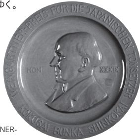
WEINGARTNER-Preis 1939 (ワインガルトナー日本作曲家賞、個人蔵)