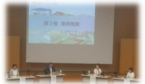
【7/15 推進フォーラム2023茨城 於:県庁講堂】

「学校や地域、家庭が一体となって子どもを育てるコミュニティ・スクールの質の向上」を目指し、『地域とともにある学校づくり推進フォーラム 2023 茨城』(R5.7.15)が茨城県庁講堂で開催されました。開会式では、永岡桂子文部科学大臣(当時)は、「現代の子どもたちは予測困難な時代を生き抜いていかなければならない。持続可能な社会の担い手の育成と、日本社会に根差したウェルビーイングの実現へコミュニティ・スクールは重要」と述べられていました。フォーラムでは、有識者による座談会や牛久市教育委員会、牛久南中学校、水戸市教育委員会の事例発表がありました。当日の動画や資料等については、文科省 HP(下記 QR コード・URL)に掲載されておりますので、ぜひご覧ください。