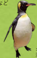
オウサマペンギン 海に進出した鳥類