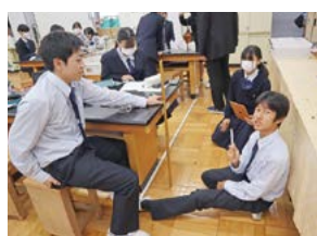
シャープペンシルの芯の強度を 研究しています

楽しそうに取り組んでいました。これから年度後半に向けてフィールドワークや実験・実践が予定され、生徒たちはそれぞれの「知」を探究していきます。