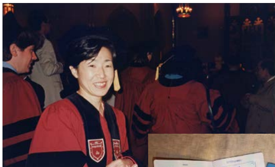
上:フォーダム大学大学院(アメリカ)の卒業式 右:国連職員のパスポート。スタンプがたくさん!

学生でも社会人になってからも、自分の能力や人間関係など、必ず行き詰まりはあります。ぶつかること、悩みや困難があっても、好きなことならば続けられます。