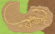
コエロフィンス およそ2億年前の 肉食恐竜