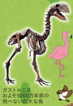
ガストルニス およそ5000万年前の 飛べない巨大な鳥