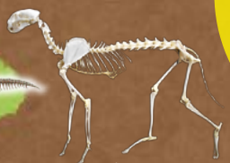
サーバル 足が速く瞬発力が優れた肉食のほ乳類