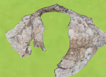
ナガスクジラ科の頸椎 (頭骨につながる首の骨) 茨城県日立市から産出