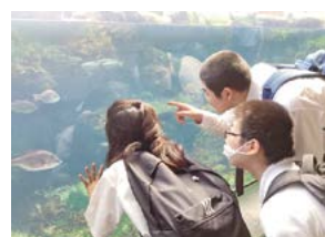
校外学習での活動風景

海の動物たちの生態や、絶滅の危機に瀕している動物について、インターネットやアプリ、図鑑などの様々な媒体から情報収集を重ね、また、フィールドワークでは、大洗アクアワールドを訪れ、海の生物の生態や環境を守るためにできることについて説明