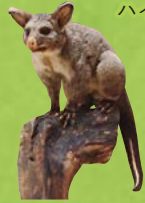
フクロギツネ 有袋類