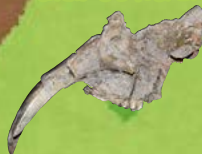
ステゴロフォドン(ゾウ類)の頭骨 茨城県常陸大宮市から産出