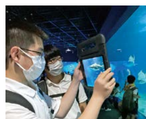
気になる魚をタブレットで撮影

を受けました。今後の学習では、「共生する動物のために、今の自分たちにできることは、何があるのか」を生徒一人ひとりが考え、発表を行います。