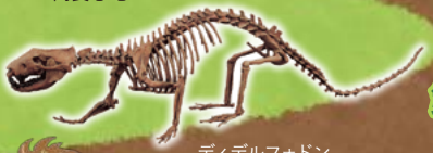
ディデルフォドン およそ7000万年前の 大型のほ乳類

恐竜とほ乳類が戦う? いえいえ、今回の企画展は恐竜とほ乳類をくらべて、学ぶことを目的としています。くらべてみるとわかることがいっぱい。あなたは何を見つけられるかな?