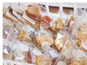
賞味期限が過ぎた 茶葉を活用した石鯀

また、年に8回「さはらっ子総会」を行い、さはらファミリー会社の運営や活動について、児童自らが率先して考え、話し合いや反省を繰り返し、より充実した学びにつなげています。