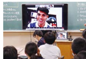
ラオスとのオンライン交流

介護施設で働く方から、福祉の実態や仕事への働きがいなどを熱く語っていただきました。また、パラスポーツの体験やラオス・東京・学校の3地点をオンラインでつなぎ、外国で障害者支援を行う方やバリパラリンピックを目指す選手との交流を行い、外国の障害者福祉についての理解も深めました。