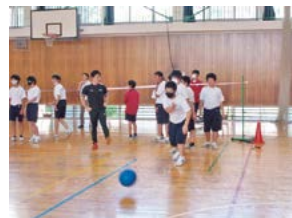
パラスポーツ 「ゴールボール」体験風景