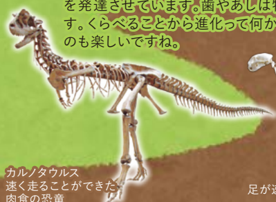
カルノタウルス 速く走ることができた 肉食の恐竜

生物の体は、食事や移動の方法によってさまざまな特徴を発達させています。歯やあしは特に特徴的です。くらべることから進化って何かを考えてみるのも楽しいですね。