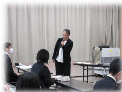
【主任社会教育主事の講話】