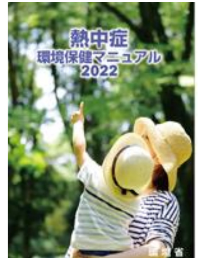
「熱中症環境保健マニュアル2022」 (令和4年3月改訂 環境省)