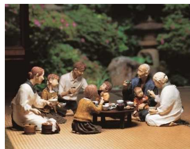
「ちゃぶ台囲んで」 安部朱美作 2009年