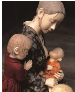
「かあちゃんよんで」 安部朱美作 2007年