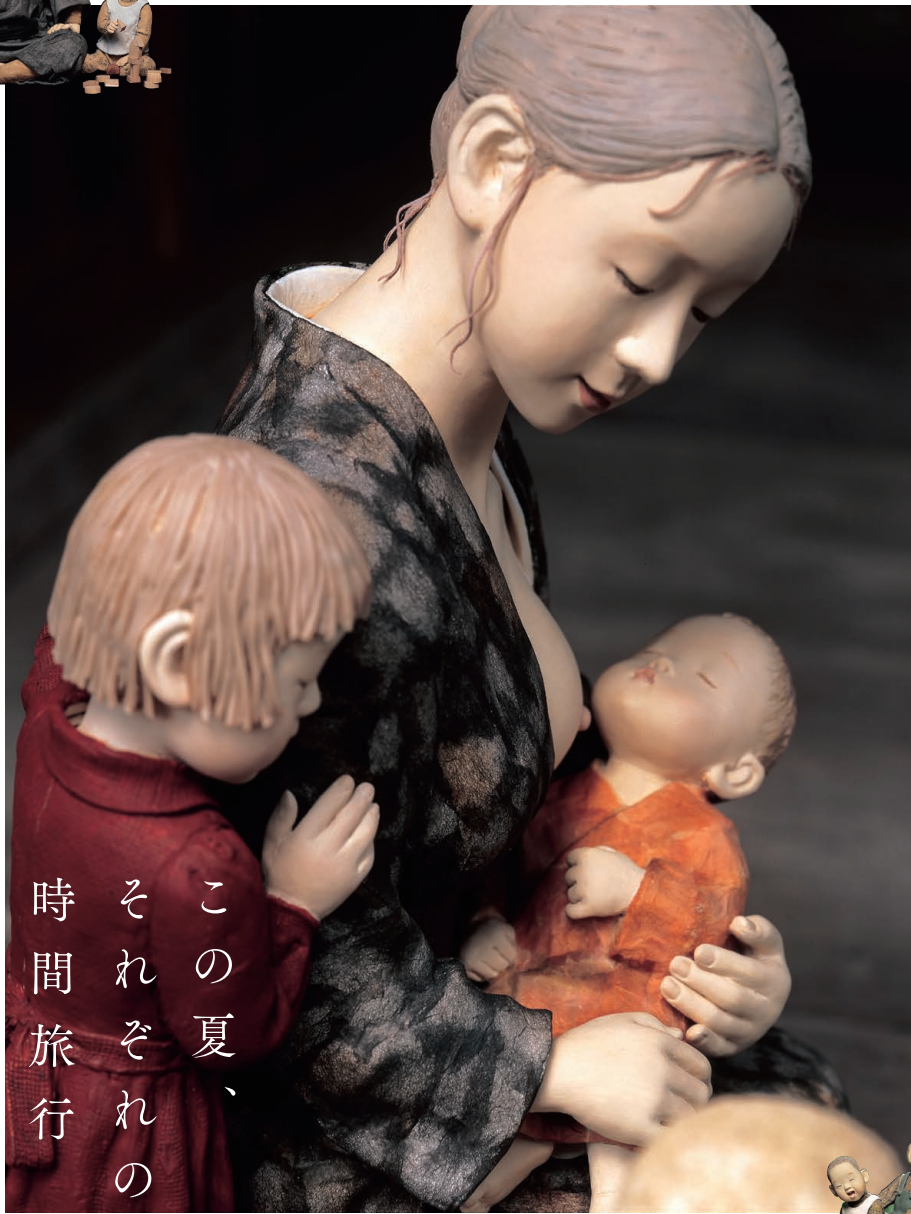
「かあちゃんよんで」(2007)