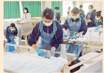
臨床指導者協力校内実習

校内には、実習棟が整備されており、「全身清拭 せいしき 」等、「基礎看護」に関する質の高い校内実習が行われます。また、県内の様々な協力病院や特別養護老人ホーム等で臨地実習が行われ、実践力も磨かれます。