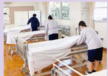
生活支援技術(ベッドメイキング)

卒業時には「介護福祉士」国家試験の受験資格が与えられ、合格すると「介護福祉士」として特別養護老人ホーム・介護老人保健施設・障害者支援施設・在宅介護サービスなどで働くことができます。また、福祉系学部をもつ大学や短大、専門学校への進学も可能であり、幅広い進路選択ができます。進学・就職後には、高校で福祉を学んだことをベースとして、さらに多くの知識を身につけ、福祉専門職としての意識や資質をさらに向上させることもできます。