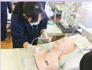
医療的ケア(喀痰吸引)

同校の福祉科では、高齢者・障害者などを支える「介護福祉士」の資格取得を目指します。高齢者や障害者を支えるために必要な知識・技術をしっかりと身につけられるよう、介護技術、福祉に関する歴史や法律・制度、人間の身体構造や病気について学ぶ専門科目を学習します。福祉施設での校外実習や特別支援学校体験、ボランティア活動といった様々な体験を通して、人と関わる職業に必要な資質を高め、奉仕の精神を養い、人間の成長を支援しています。