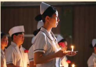
たいばう 戴帽の儀

入学後、本科(3年間)では高等学校普通科目と看護に関する科目の基礎・基本を学習し、