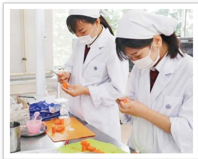
上段：衛生看護科の実習の様子(県立岩瀬高等学校)