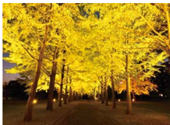
いちょう並木のライトアップ