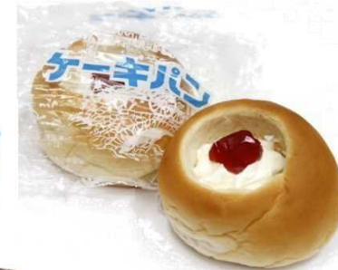
味噌ケーキパン (石岡第二高校)