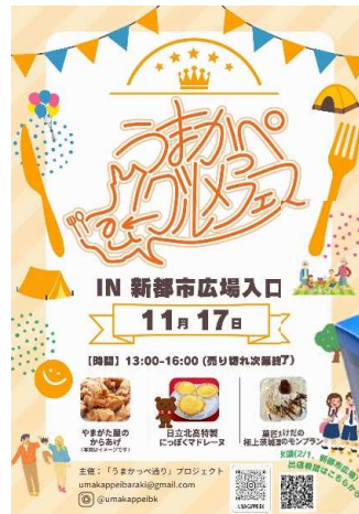
フェス開催チラシ (日立第一高校)