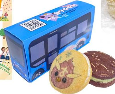
古河一高マスコットキャラクター 古一丸(こいちまる)