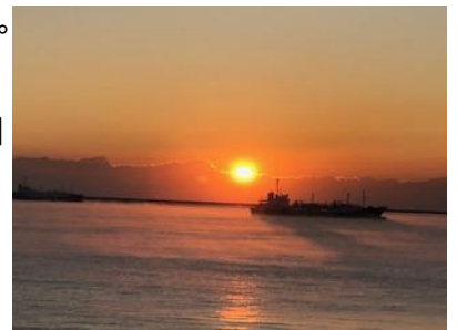
鹿島灘に昇る初日の出