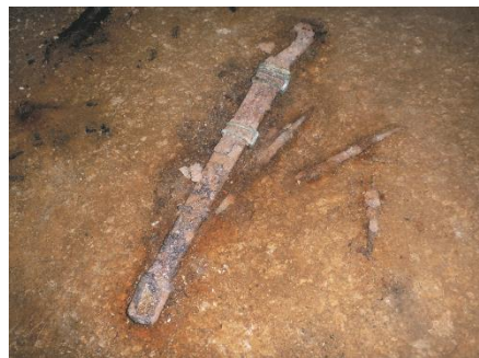
第35号墓玄室内・大刀・刀子出土状況