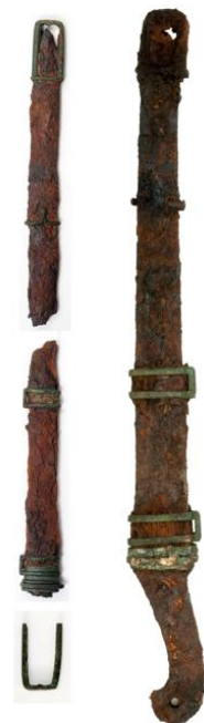
（左）第32号墓出土・方頭大刀（右）第35号墓出土・蕨手刀