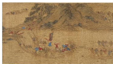
倭寇図巻（東京大学史料編纂所蔵）