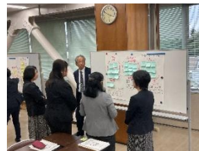
【ギャラリーワークの様子】