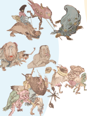
暁斎百鬼画談(部分) 明治22年(1889) 当館蔵

地下で大あばれして地震をおこすと信じられていたナマズ…。そんなナマズをユーモラスにえがいた浮世絵が江戸時代に大流行! 5種のスタンプをおして、ナマズ絵を完成させよう。