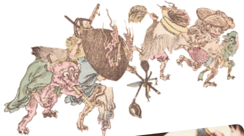
晩斎百鬼画談(部分) 明治22年(1889)当館蔵