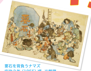
要石を背負うナマス 安政2年(1855)頃 当館蔵