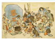
要石を背負うナマズ 安政2年(1855)頃 当館蔵

好きな妖怪をえらんでタッチすると、その正体がわかっちゃう?! 自分だけのオリジナル妖怪も作っちゃおう。