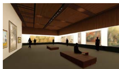
五浦美術館リニューアル事業

県立高等学校において外国人生徒に対する学校生活の支援や日本語指導を一層強化することで、学校における円滑な受け入れ体制を整備し、地域社会の担い手を育成します。