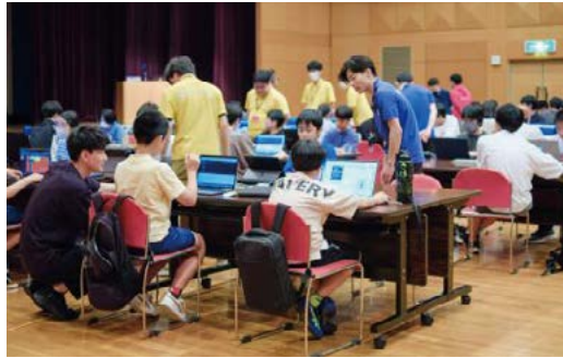
プログラミング・エキスパート（対面講習会）