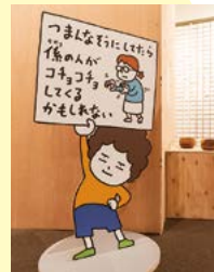
※写真は世田谷文学館での展示の様子です

企画展を見終わったあとには、いつものなげなく見えているものの見方がちよっぴり変わっているかもしれません・・・。