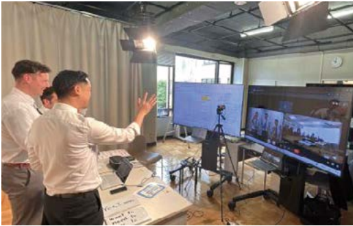
ライブ授業配信の様子