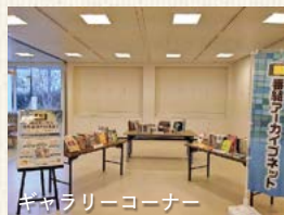
ギャラリーコーナー