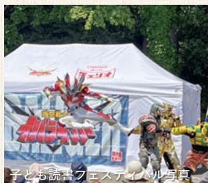
子ども読書フェスティバル写真