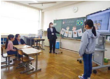
日本語支援の様子