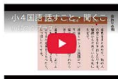
話すこと・聞くこと1に関する学習A

いばらきオンラインスタディ plusでは、国語・算数(数学)・理科・社会・英語の学習ができます!