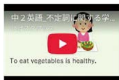
不定期に関する学習B