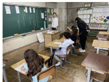
日本語支援の様子