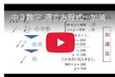
連立方程式～加減法に関する学習A