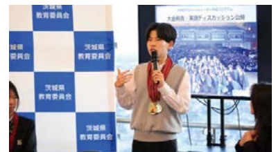
NGGL海外挑戦フォーラム

小学校でフッ化物洗口を実施するにあたり、教員業務支援員を配置する市町村を支援する制度です。むし歯予防に効果のあるフッ化物洗口の取組を進め、児童の歯の健康を守ります。