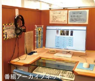
番組アーカイブネット

約103万点の資料を所蔵。興味やライフスタイルに合う一冊を見つけ、学びや日々の暮らしに活かすことができます。