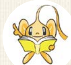
マスコットキャラクター ブック・マークン

※掲載情報は5月29日時点のものです。 ※最新情報はHPかお問い合わせでご確認ください。