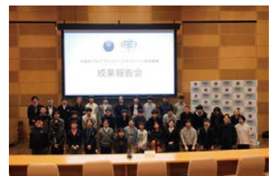
プログラミング・エキスパート